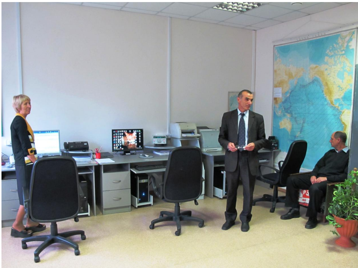
В гостях в операционном зале Центра цунами Камчатского УГМС