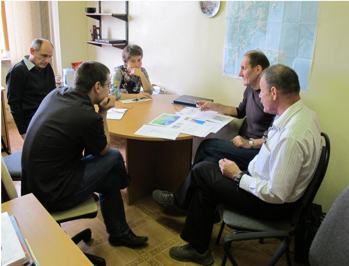
Научная дискуссия в разгаре