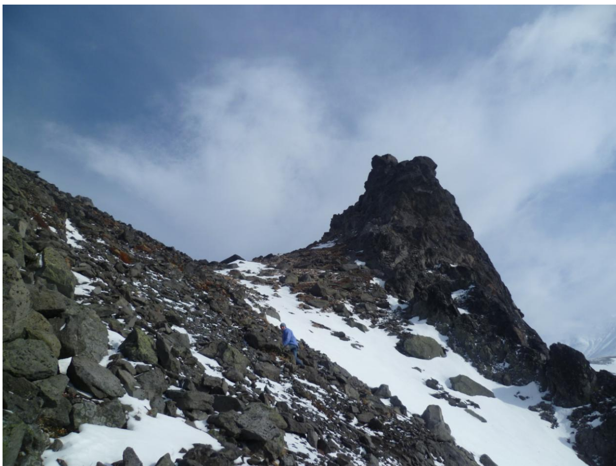
В один из дней для желающих была организована экскурсия на экструзию Верблюдов на перевале между Корякским и Авачинским вулканами