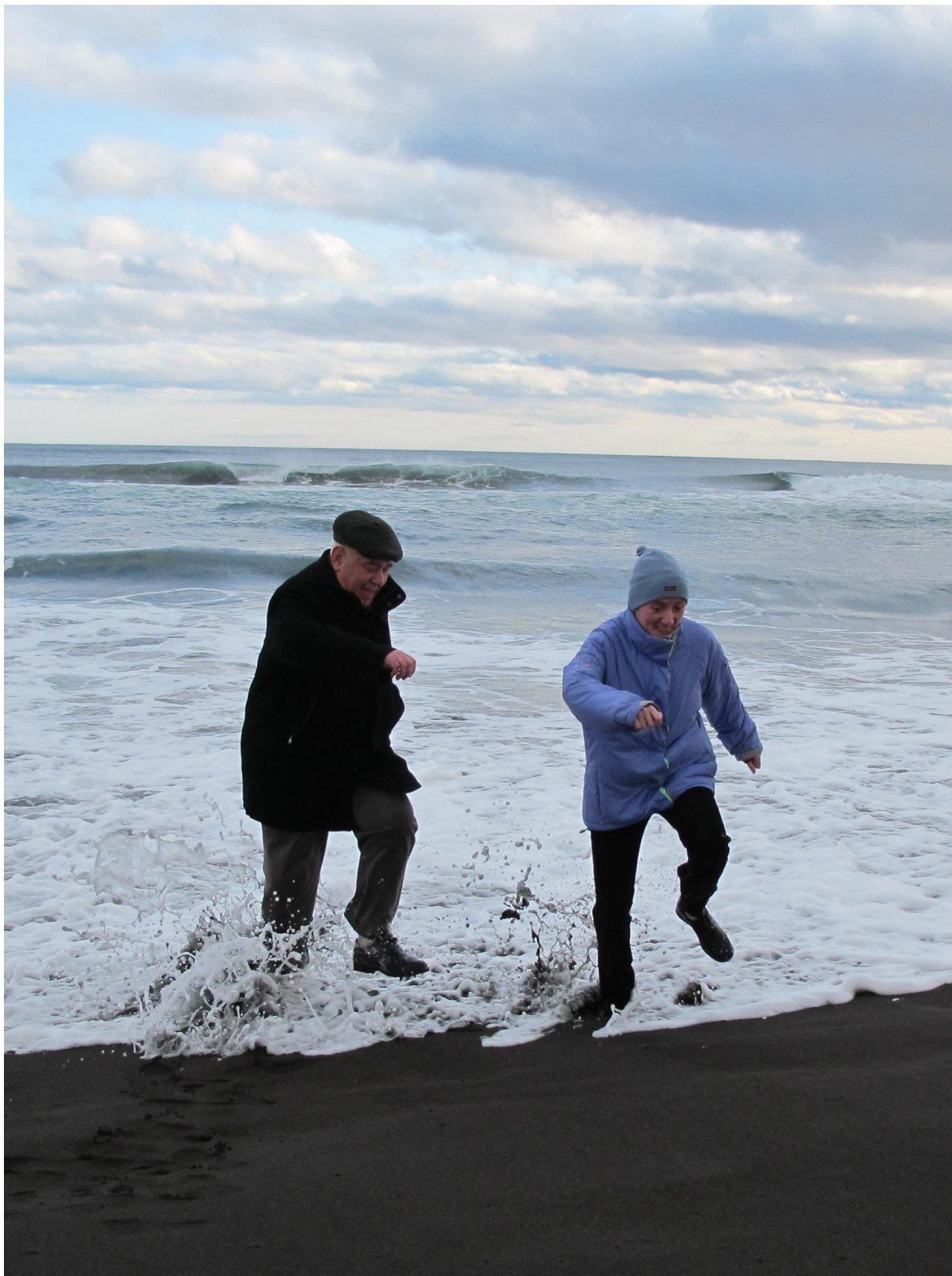
От волны цунами действительно не убежишь