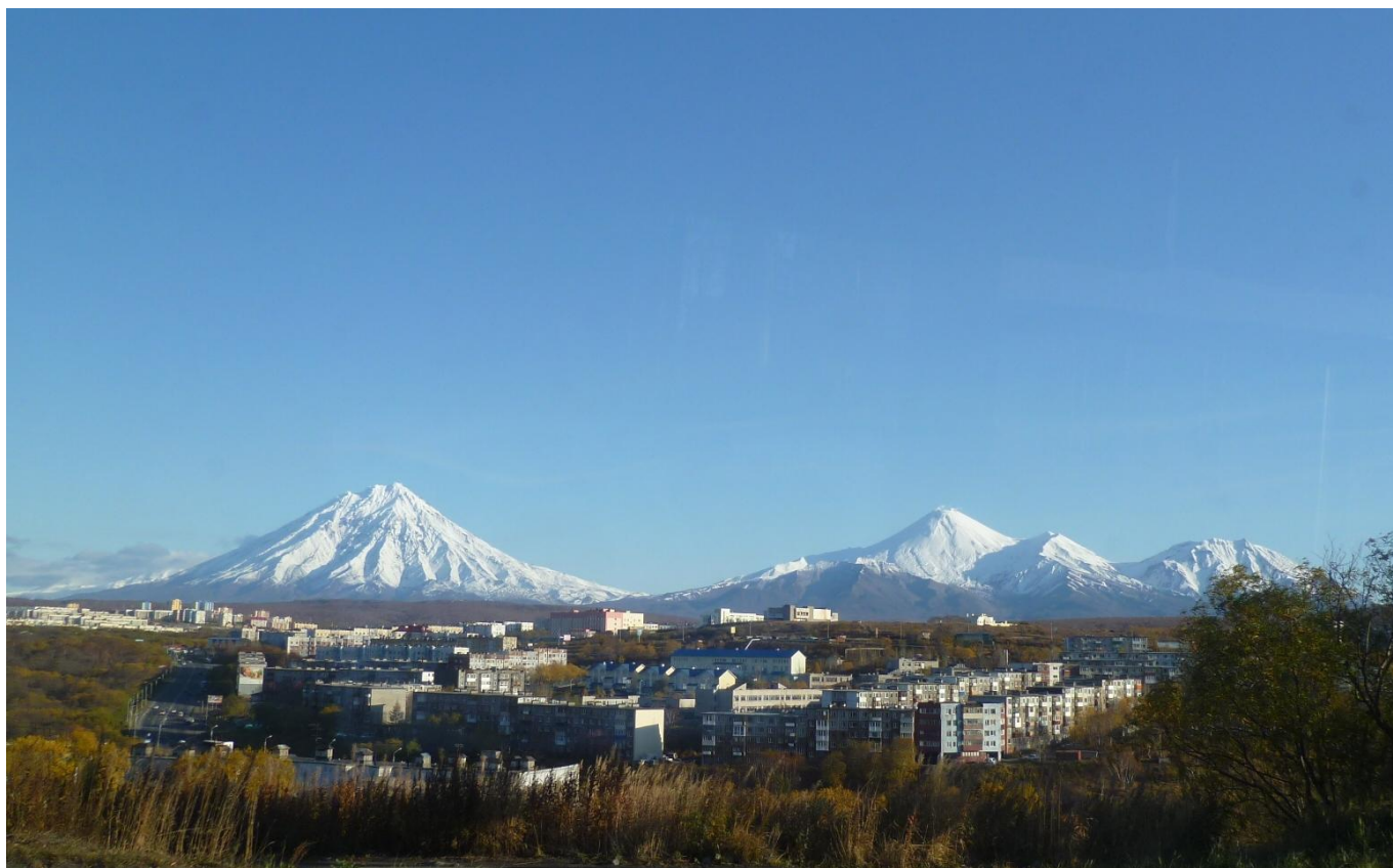
Город Петропавловск-Камчатский расположен у подножия вулканов Корякский, Авачинский и Козельский