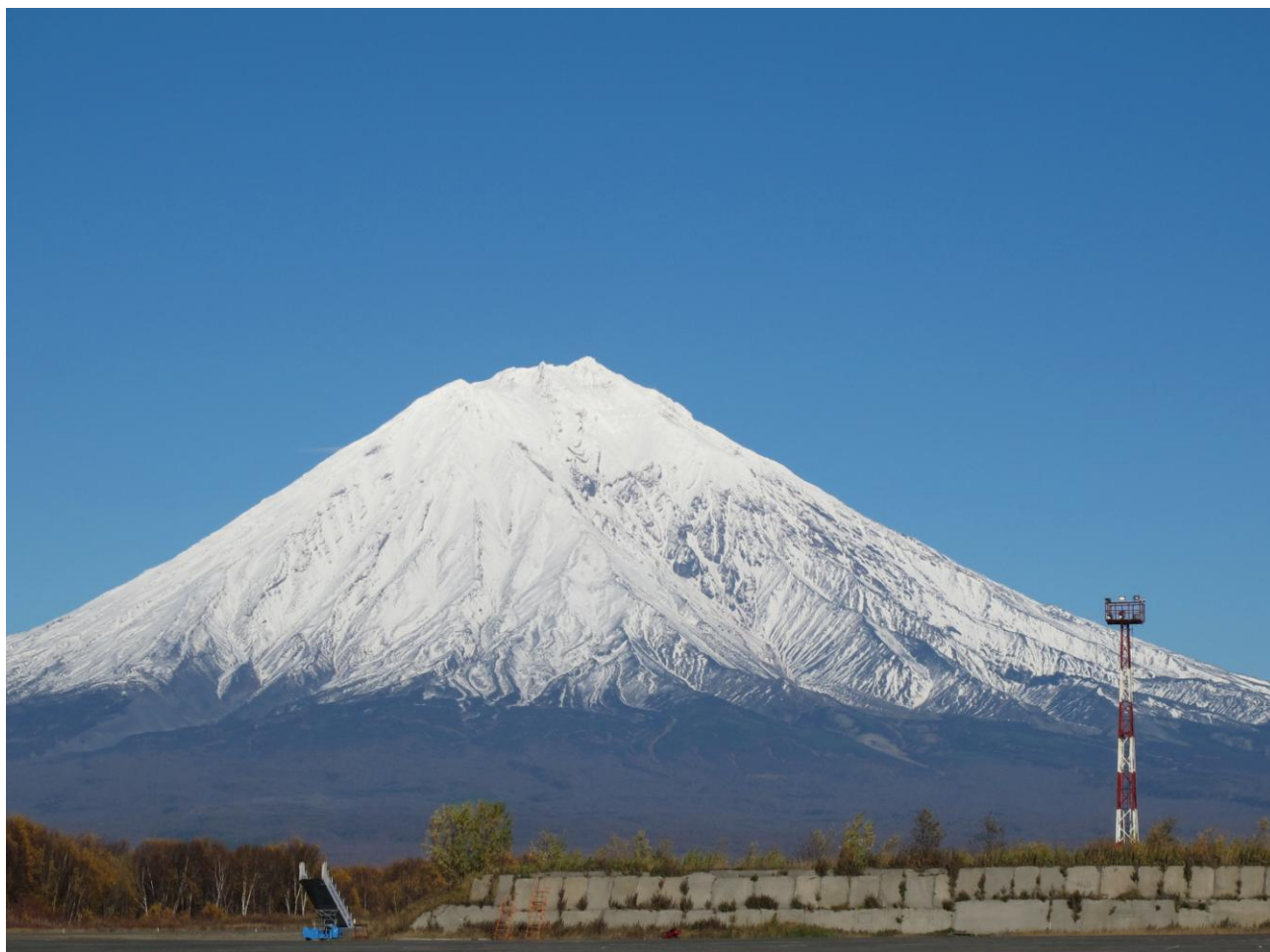
Красочный вид с площади у аэропорта Елизово