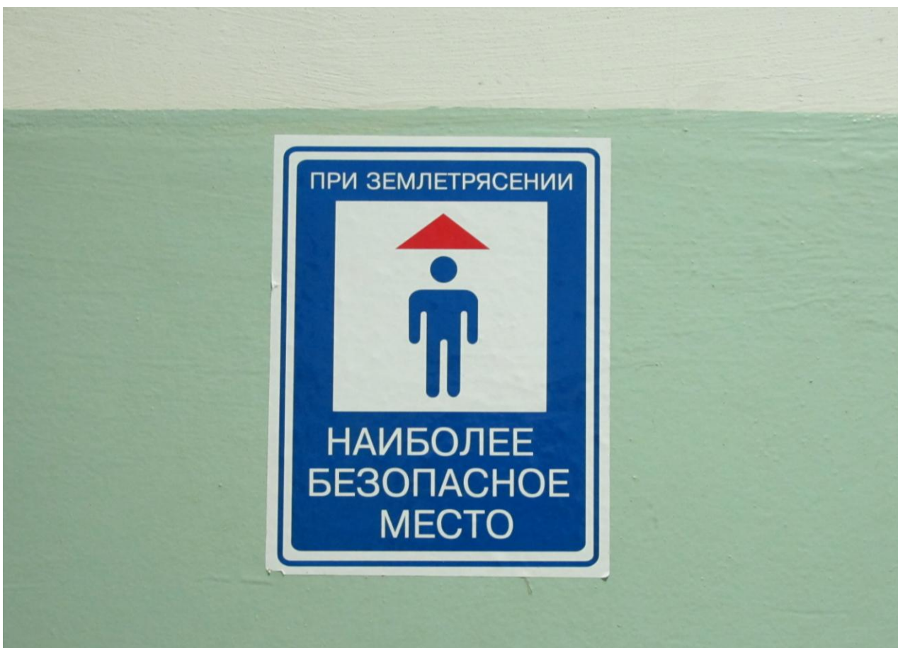
Надпись в Институте вулканологии и сейсмологии ДВО РАН. А наиболее безопасное место при цунами – в ИВТ СО РАН