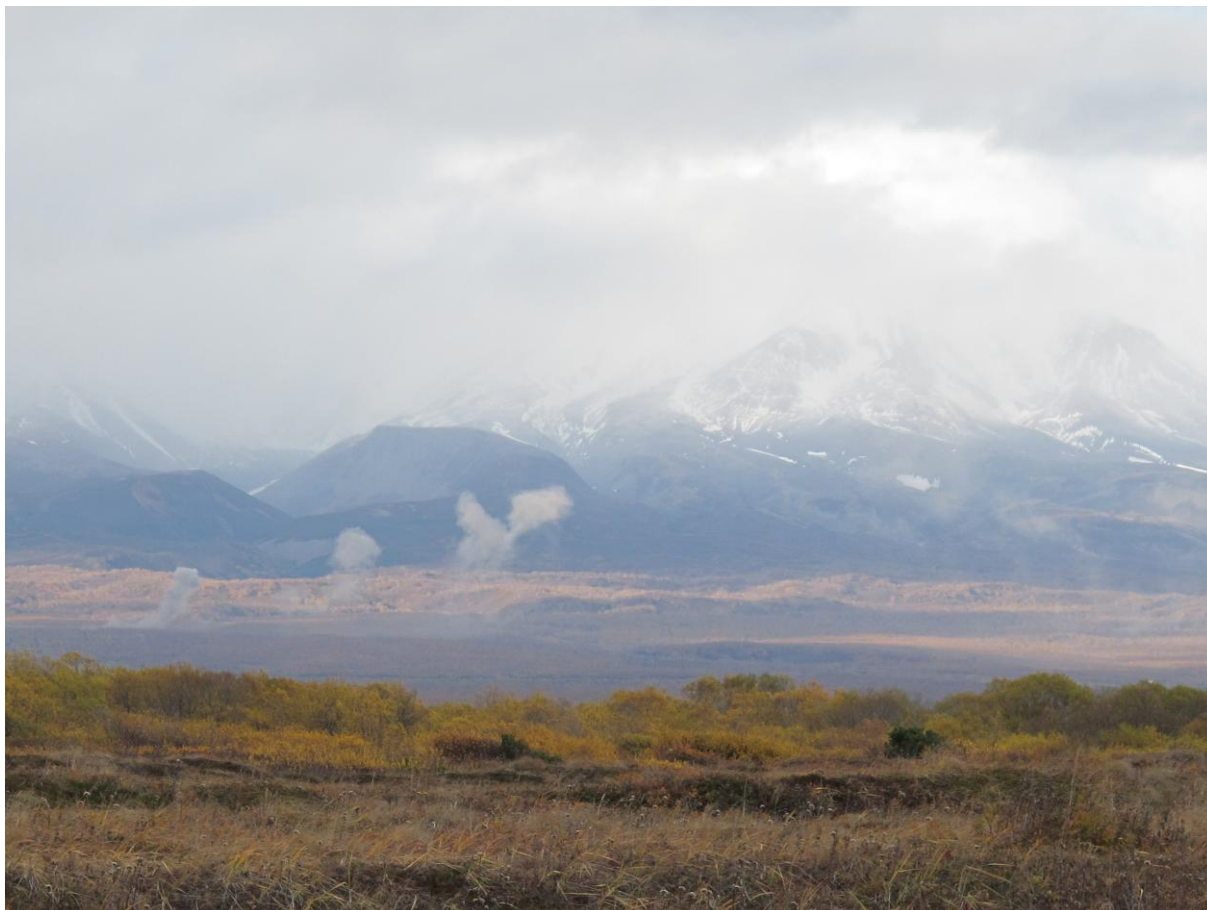
Дым вдалеке слева – от взрывов старых боеприпасов. До взрывов на новосибирском полигоне в Шилово им далеко.