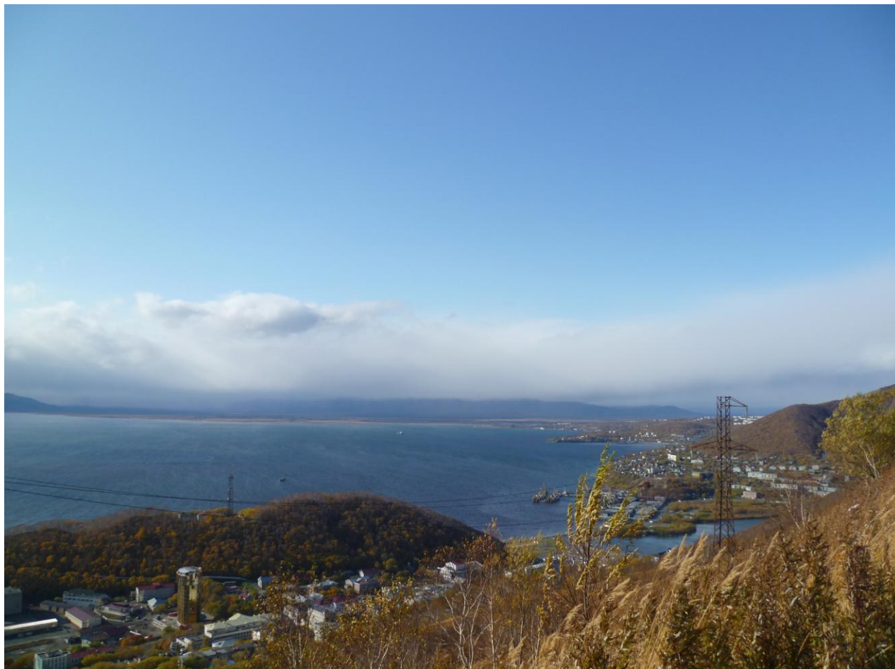
Авачинская бухта со смотровой площадки