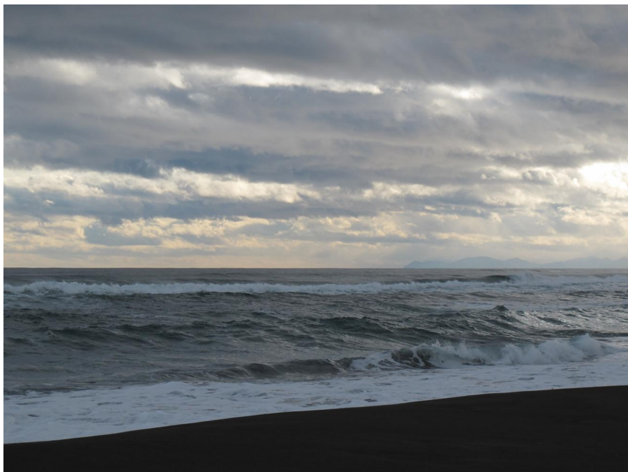
Халактырский пляж, побережье Тихого океана